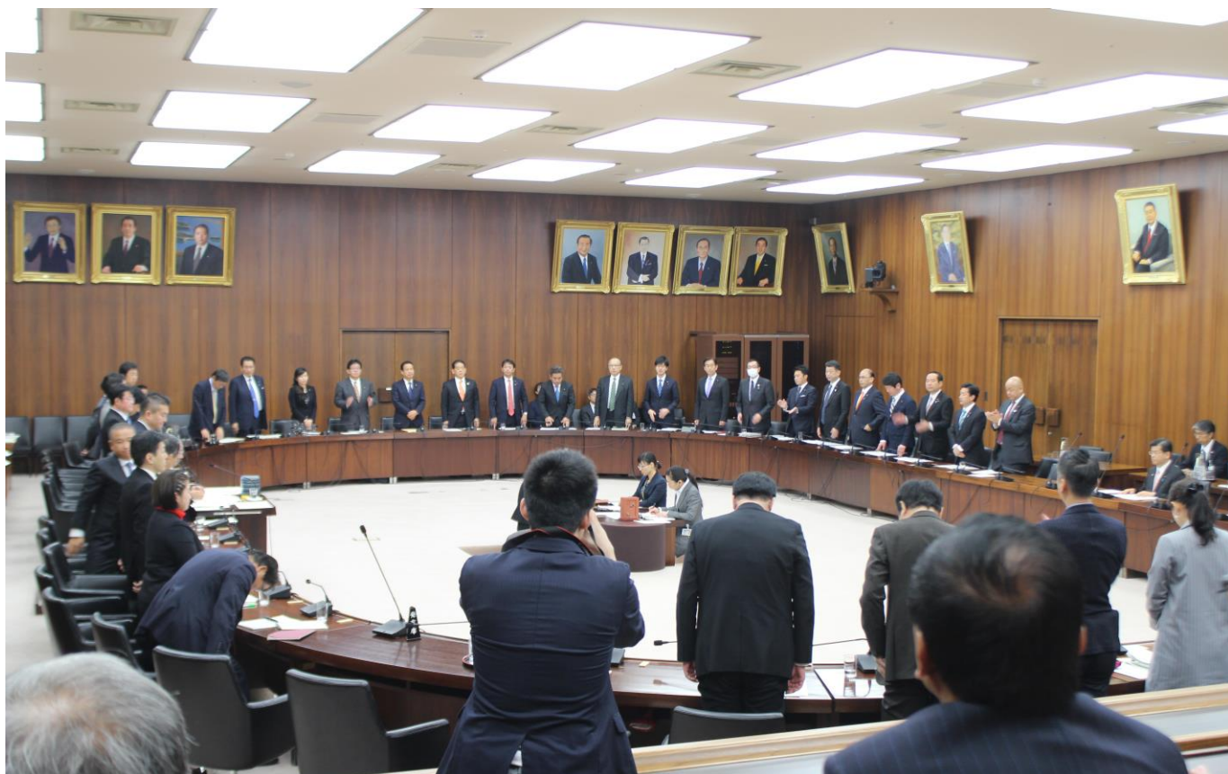
平成 28 年 12 月 9 日午前、衆議院国土交通委員会での採決の様。全会派が一致して起立し法案に賛成。

私が事務局長を務めてきた与党議連で 3 年 6 か月検討してきた議員立法が、平成 28 年 12 月 9 日について成立しました。法律の名前は「 建設工事従事者の安全及び健康の確保の推進に関する法律 」という長い名前のため、仲間の国会議員からは実質的に取り組んできた私の名前にちなんで、よく「 桜田法案 」と呼ばれております。今回の法律は、建設業における深刻な労働災害の発生状況に鑑み、現場で働く建設工事従事者の安全と健康を確保し、処遇の改善と地位の向上を図り、社会に欠かせない建設業に係る皆様の為になる法律です。今回の基本法の成立に迈り、衆・参の国交委員会、また衆参両本会議でも全会一致で成立したことは、この法律の重要性が与党・野党問わず御認識いただけたことであると思います。今後日本各地で 2020 年のオリパラ関連工事、新幹線工事(リニア)、老朽化したインフラの更新整備の工事などが本格化してきます。この法律により、現場で働く皆様の待遇や環境が改善され、誇りをもって多くの人々が建設業で働いてもらえるならば、建設業界はもちろん、我々の社会全体にとっても極めて重要な前進となりましょう。