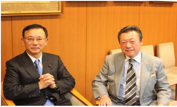
(平成 23 年 11 月 23 日 谷垣総裁と個別対談)