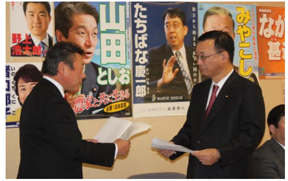
(平成 23 年 12 月 5 日 党執行部への申入れ)

憲法改正、自主憲法制定は自民党結党の原点。1955 年（昭和 30 年）の立党宣言は「内に民生を安定せしめ、公共の福祉を増進し、外に自主独立の権威を回復し、平和の諸条件を調整確立するにある」と高らかにうたっています。以来、多くの先輩方が自衛隊の合憲化や天皇元首化を提言する立場からさまざまな提案を発表してきました。