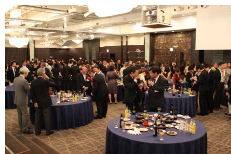
懇親会イメージ画像