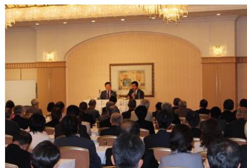
セミナーイメージ画像 第 113 回平成目安塾（平成 25 年 10 月）